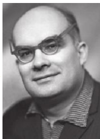
ИВАНОВ ИГОРЬ ПЕТРОВИЧ 1923–1992

Педагогика общей заботы, педагогика социального творчества, коммунарская педагогика – все эти определения относятся к одному явлению в отечественной педагогике, которая была разработана и внедрена в середине 60-х годов XX века Игорем Петровичем Ивановым, доктором педагогических наук Российской Академии образования, и его сподвижниками.