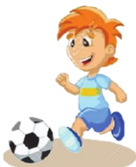
Играть в футбол: