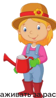
Ухаживать за растениями: