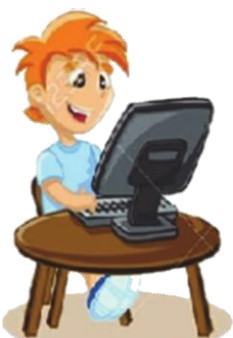
Играть в компьютерные игры: