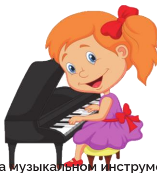
Играть на музыкальном инструменте: