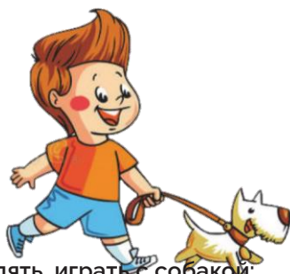
Гулять, играть с собакой: