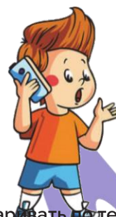
Разговаривать по телефону: