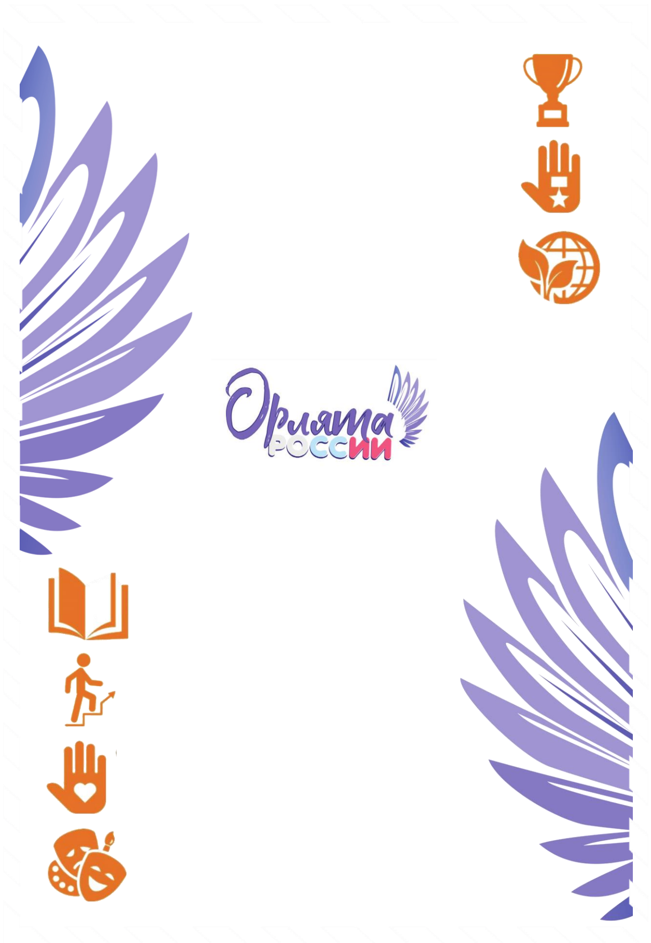
Рис. 2. Обратная сторона «Письма в Будущее»