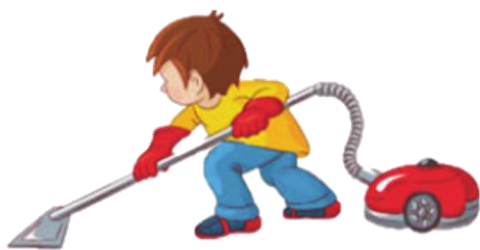
Наводить порядок дома: